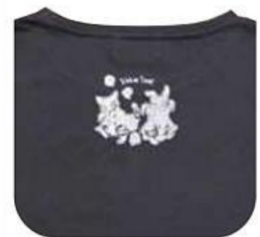
後ろワンポイント

L フール DG 941237 size L 約680×540 綿100% 日本製