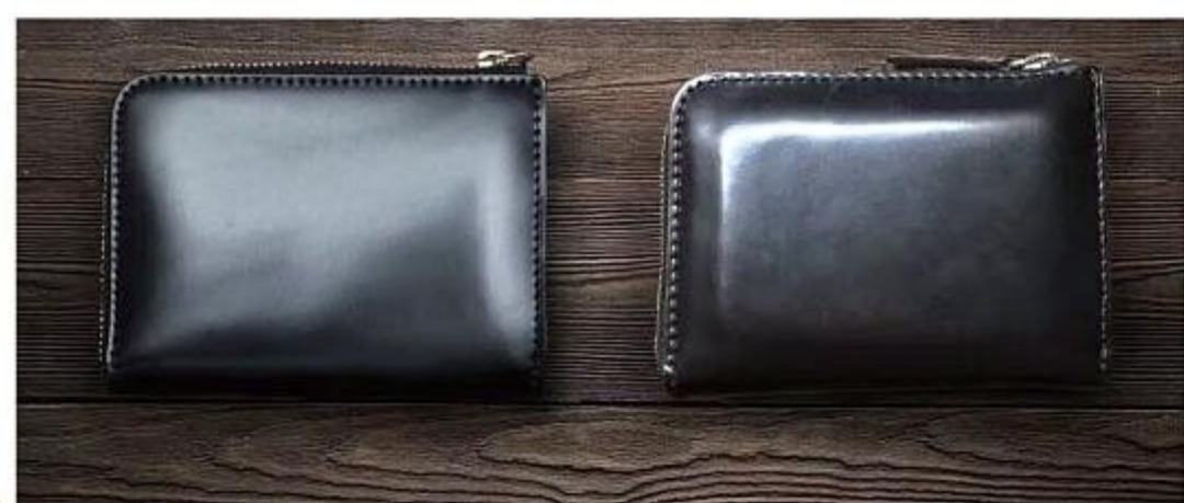
3年使用のコードバン製品

強度は牛革の約5倍、コードバンは革そのものが劣化 しづらく硬さも残るのが特徴。 また特殊コーティングをしているため、多少の水で濡 れてもバシミや水膨れなどが防ぐことが可能です。