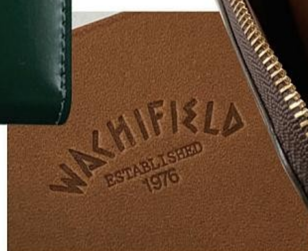
内側にも刻印入り