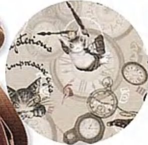
時計BABYと腕組みを あしらった絨柄裏地!